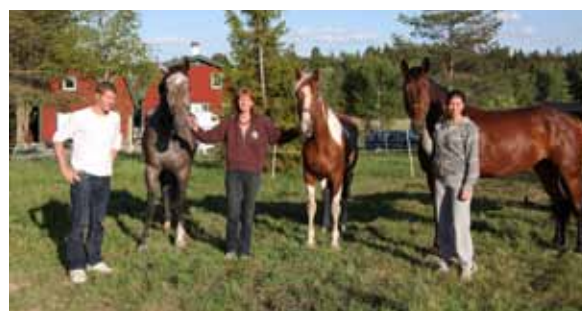
Familjen Glas-Spets har fyra hästar och plats för ytterligare inackorderingar. De kan när som helst logga in och titta på hästarna med hjälp av mobiltelefonerna.