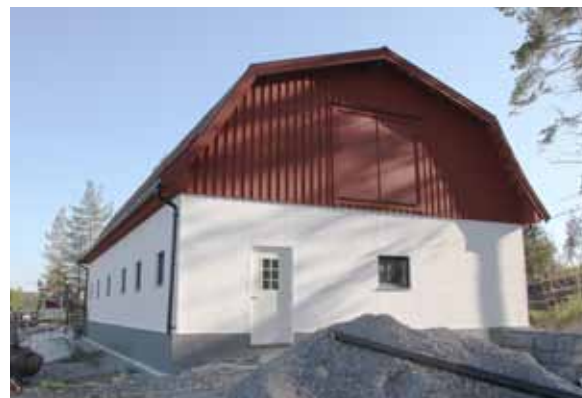
Högst uppe under taknocken sitter kamerorna som vakar över gårdens infart.